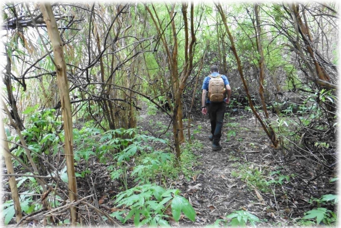
Deze Barranco sluit aan op de Barranco de la Virgen (dal van de Maagd) waar sinaasappels en citroenen groeien.