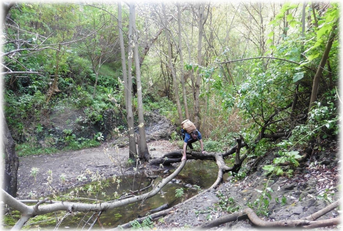
Gelukkig liggen er hier en daar omgevallen bomen die wij dan gebruiken als natuurlijke brug.