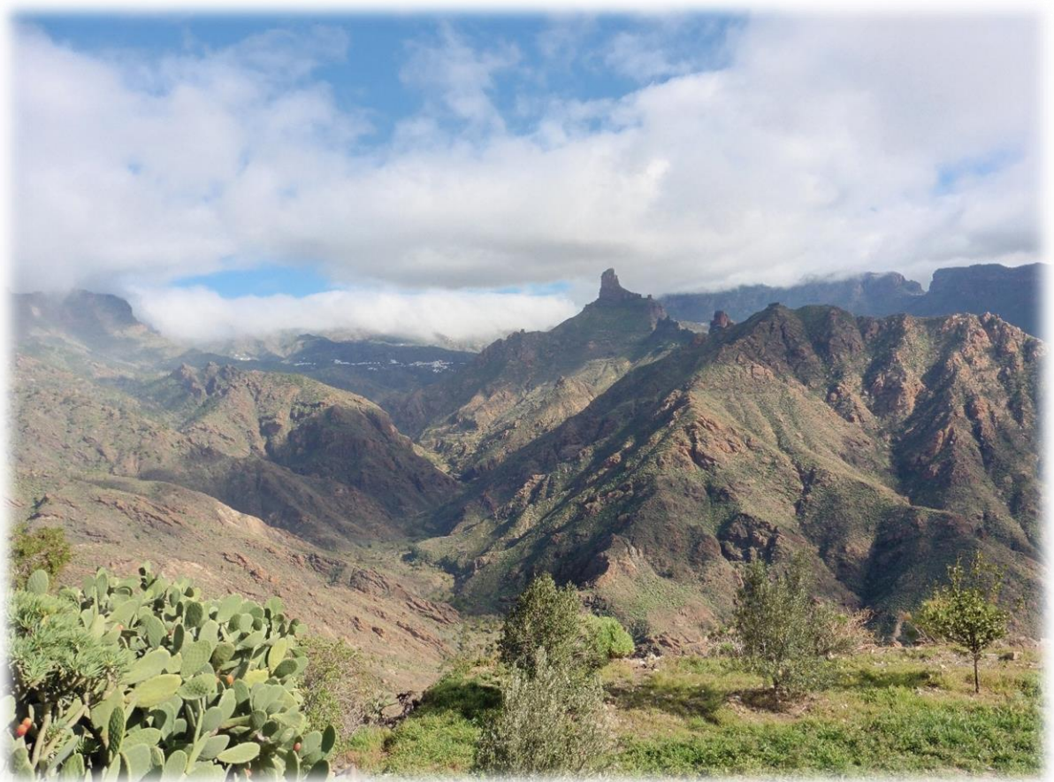
We komen aan de rand van een gigantisch dalketel en dalen af naar de tafelberg van Acusa.