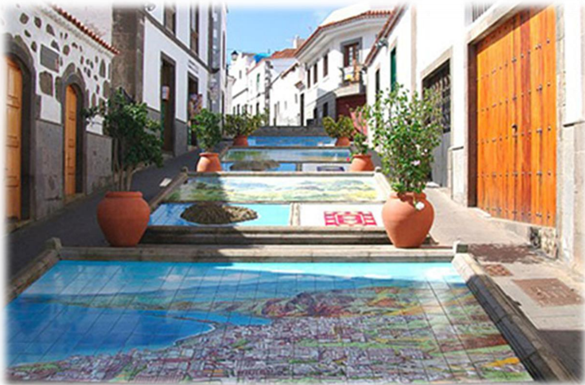
De Paseo de Canarias heeft op de grond afbeeldingen van alle zeven Canarische Eilanden, met hun wapenschilden en karakteristieke landschappen.