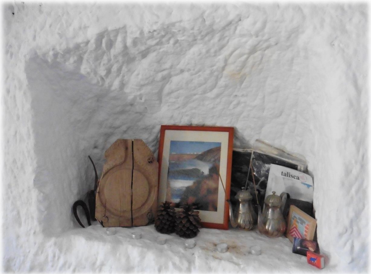
Een andere, grote grot, doet dienst als leefruimte en als slaapkamer. In de grot staan geen kasten maar men maakt gebruik van nissen die door de oerbewoners werden aangebracht.