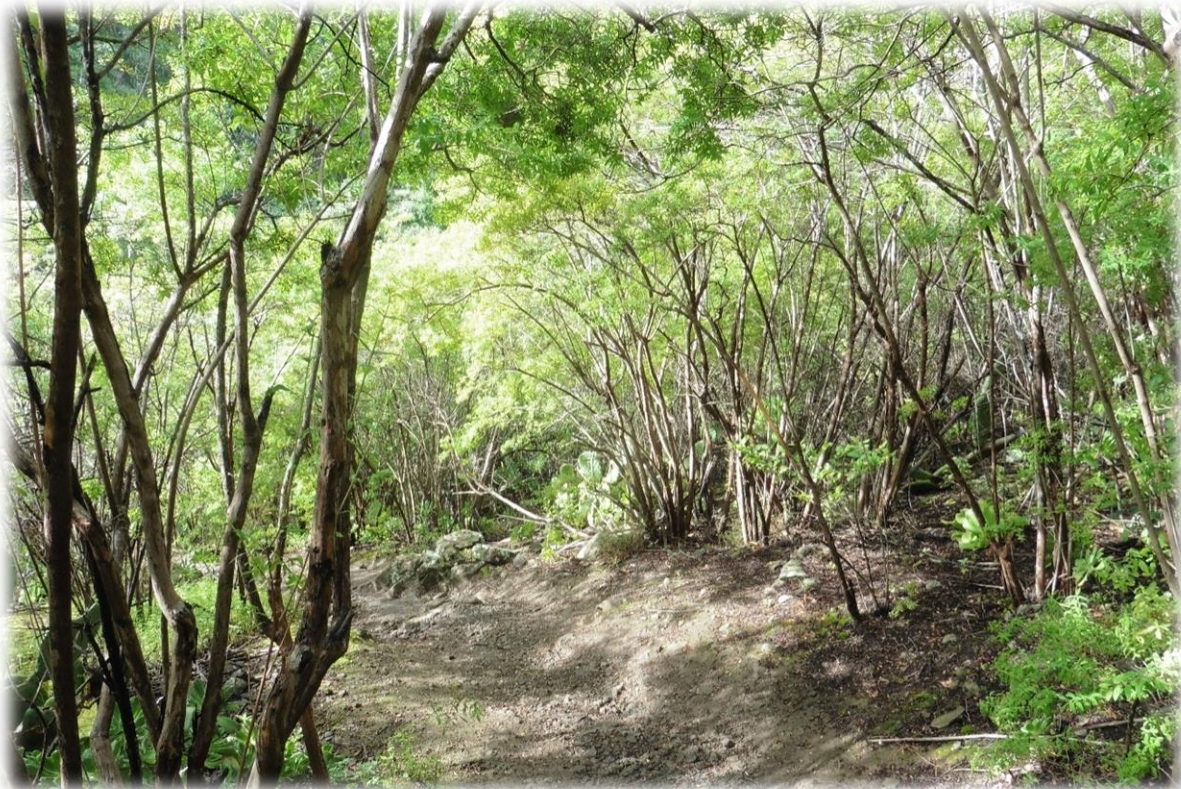
We dienen ons steeds een weg te zoeken door water en door riet- en bamboevelden.