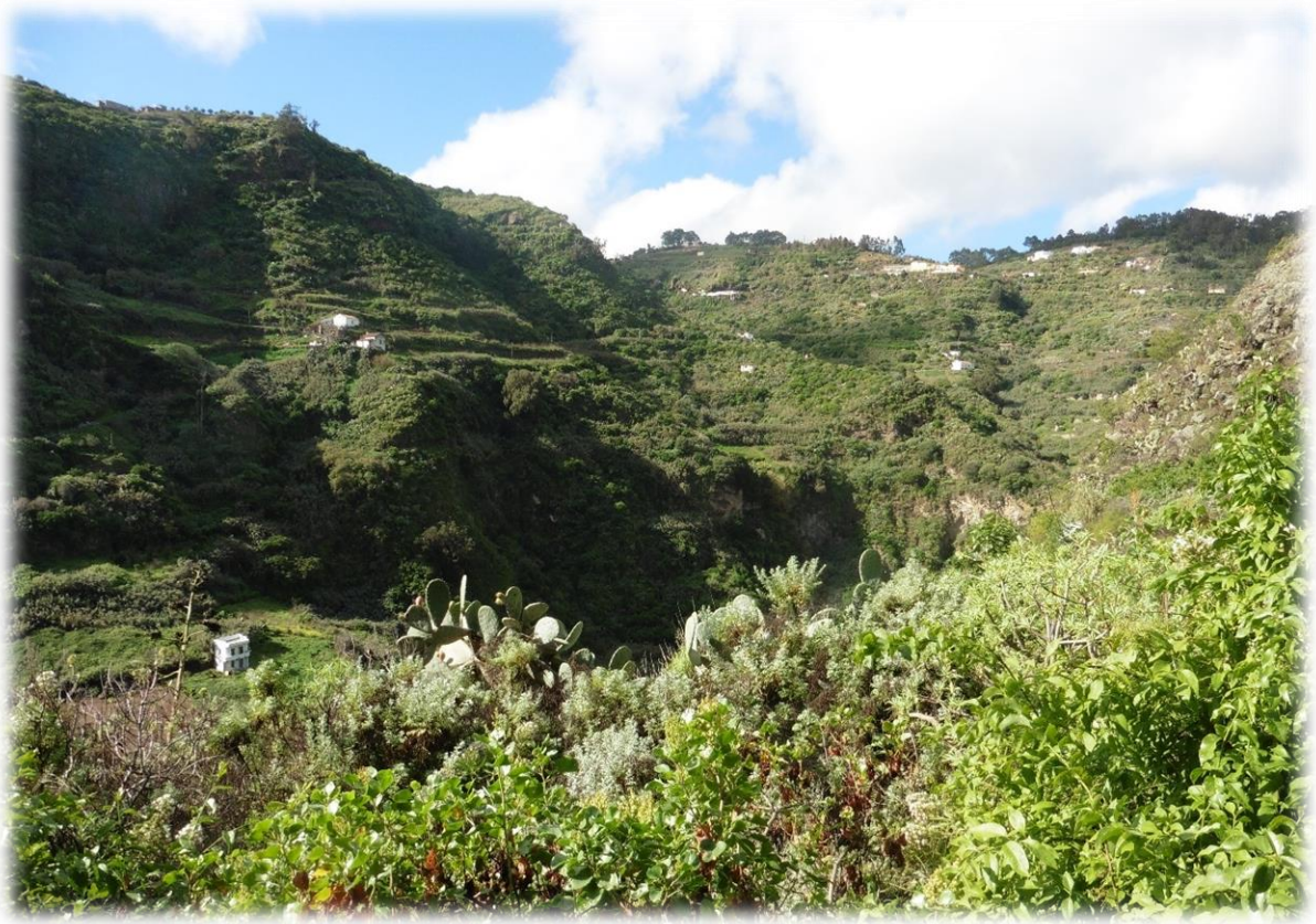
We doen vandaag de Barranco de Azuaje. Dit is een altijd waterrijke groene kloof.