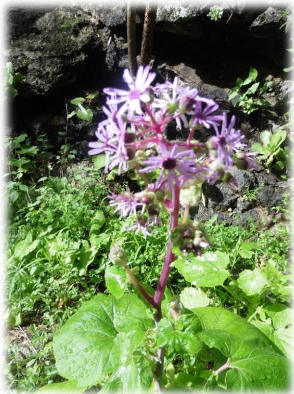
De Azuaje kloof is een door hoge rotswanden omsloten kloof met bijna jungle-achtige vegetatie van bamboe en laurierbomen, wilgen en varens.