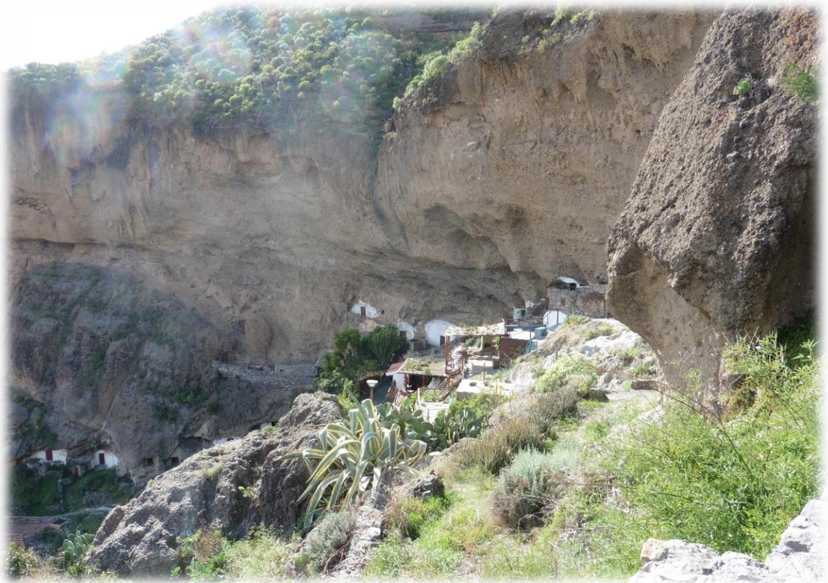
Acusa Seca mag dan wel in het hol van Pluto gelegen zijn en uit de 6de eeuw na Christus dateren, alle woningen zijn wel degelijk nog steeds bewoond.