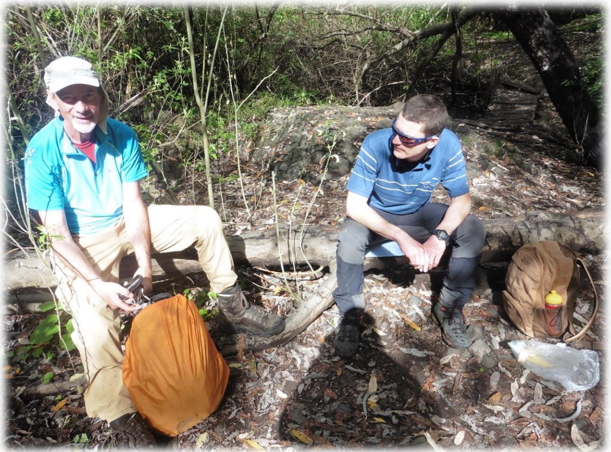
Rond de middag zoeken we ons een geschikte plaats om onze boterhammetjes te verorberen.