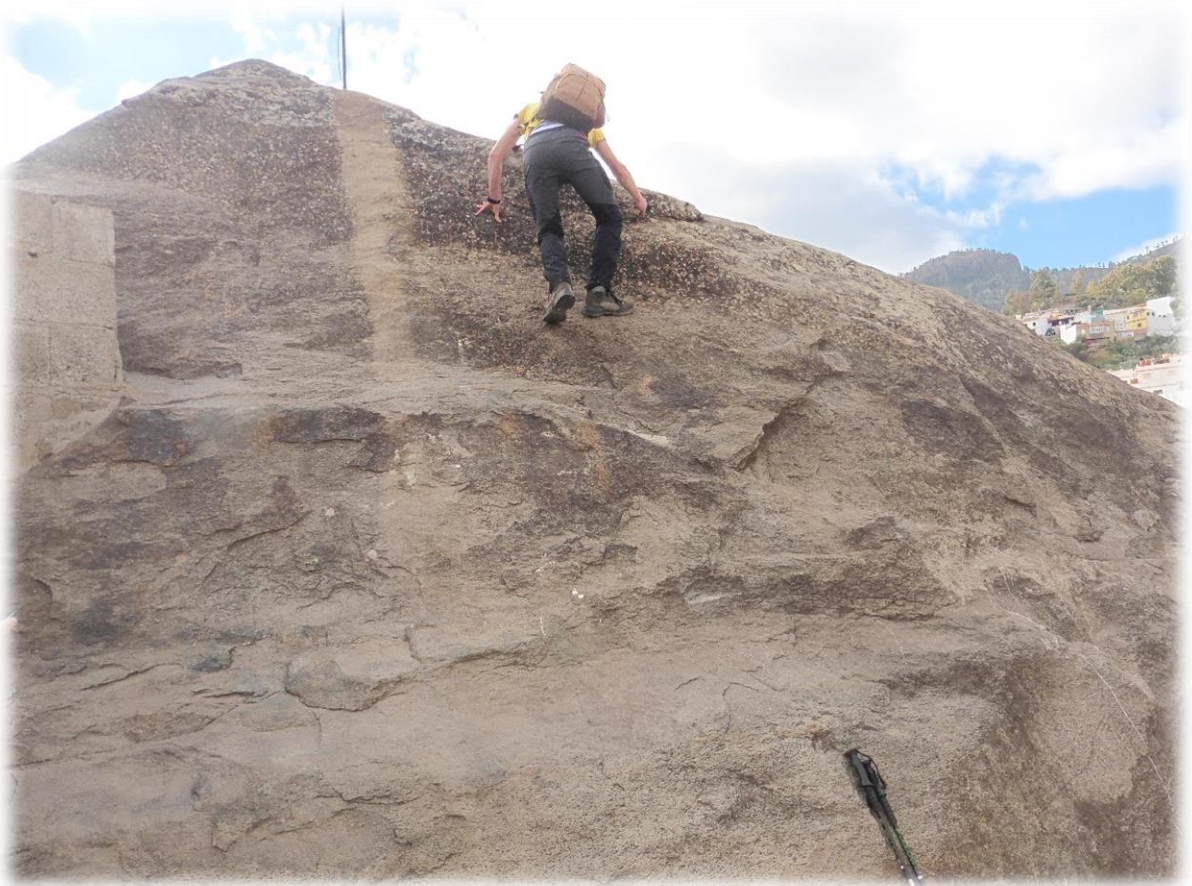
Gaston houdt er van om regelmatig eventjes een bergtop of rotspunt te beklommen. Als dit kan op een veilige manier is dat geen probleem.